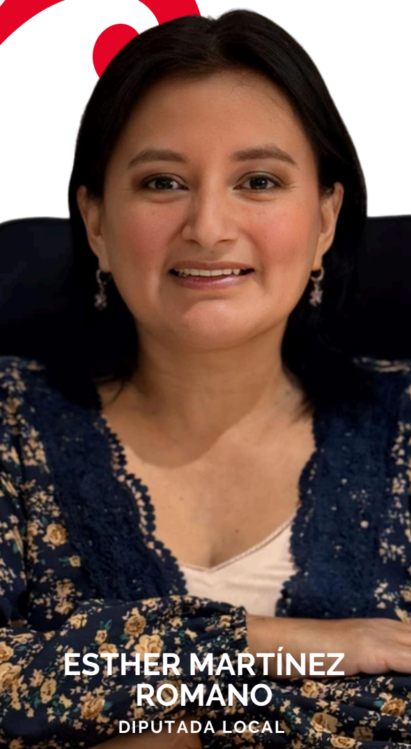
ESTHER MARTÍNEZ ROMANO DIPUTADA LOCAL

En esta quinta edición de Mujeres Petistas, Frutos de Lucha volvemos a reunir las voces de compañeras que, desde distintos lugares del estado y del país, están haciendo posible que la participación de las mujeres sea una fuerza viva en la vida pública. Este espacio nos recuerda por qué es tan importante seguir hablando, escribiendo y organizándonos: porque cada experiencia compartida nos fortalece y nos permite avanzar juntas.